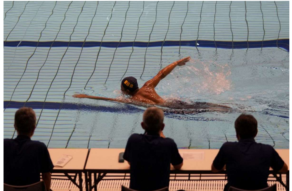
泳法競技マスタークラス