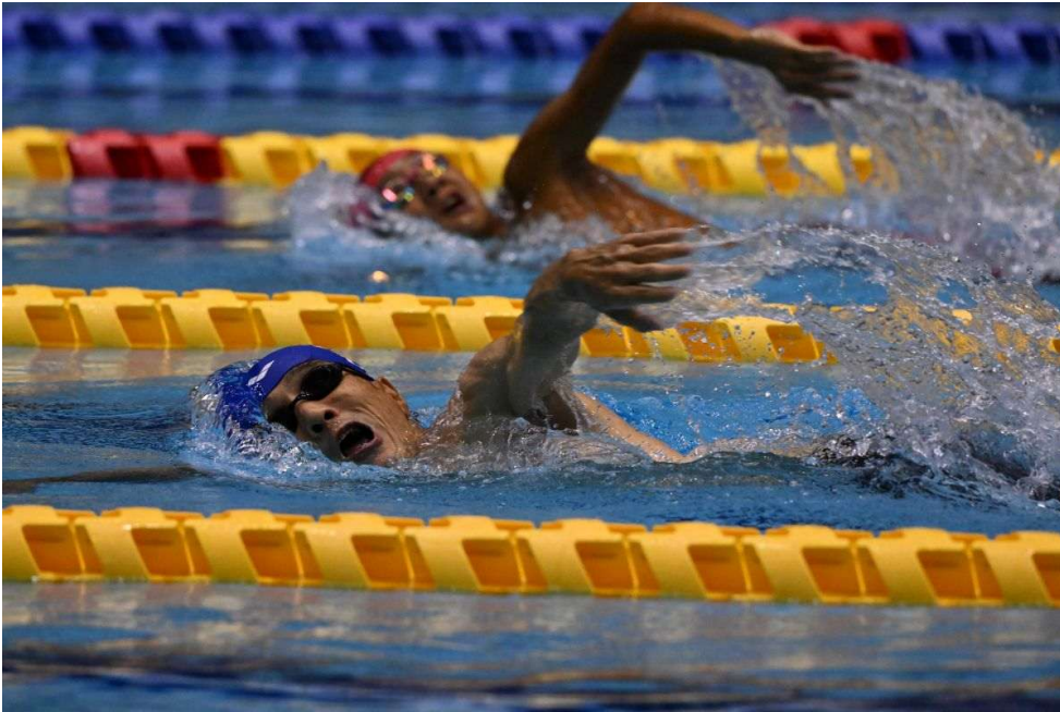
横泳ぎ競泳・男子