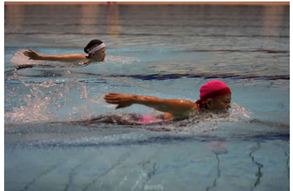
団体泳法競技シニアクラス