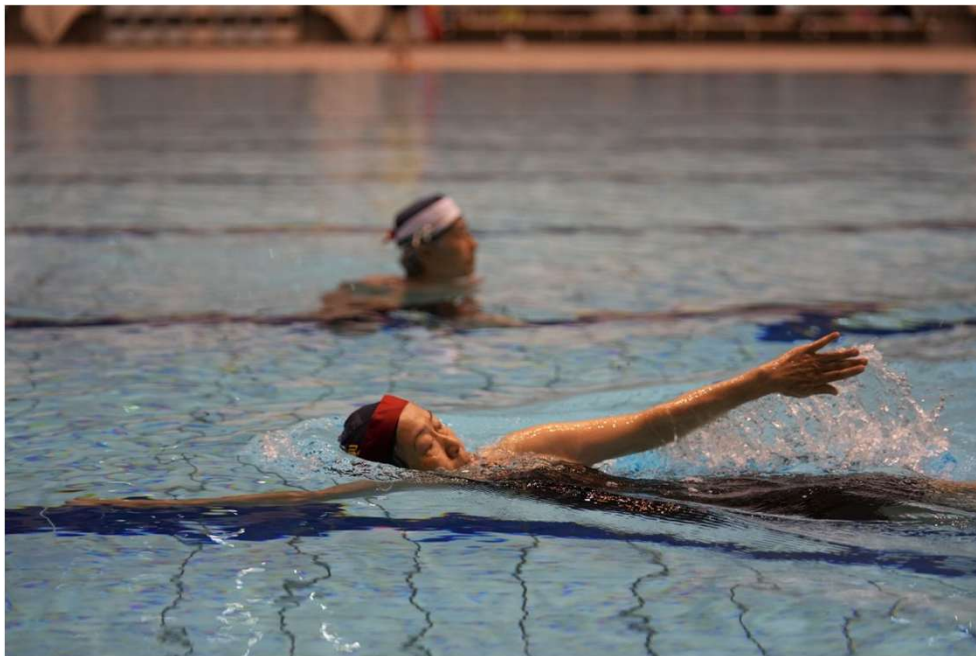
団体泳法競技シニアクラス