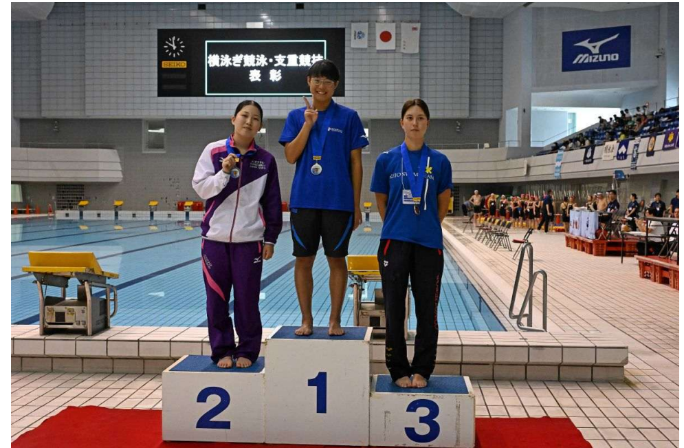
横泳ぎ競泳・女子