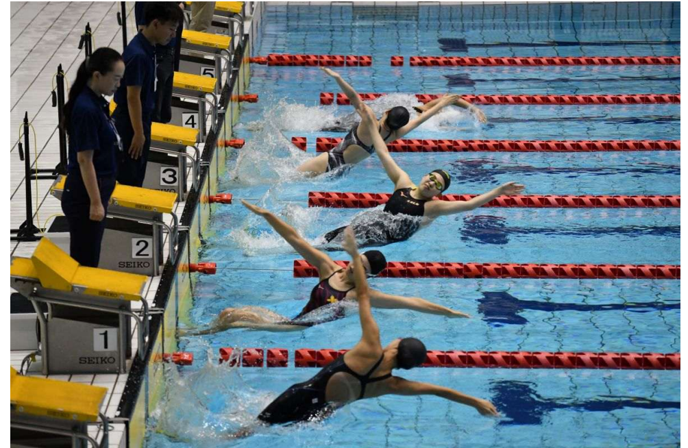
横泳ぎ競泳・女子