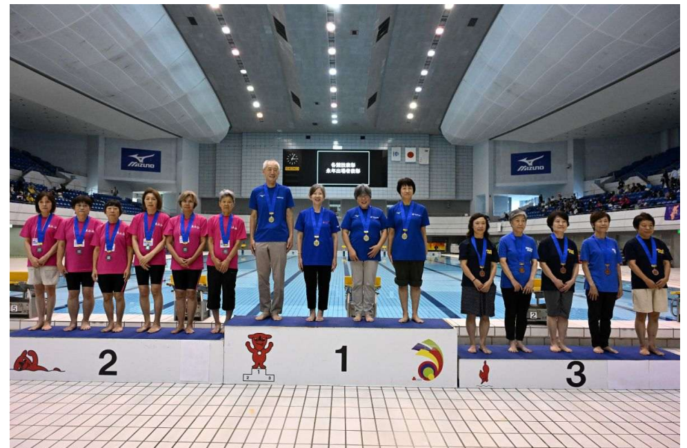
団体泳法競技シニアクラス