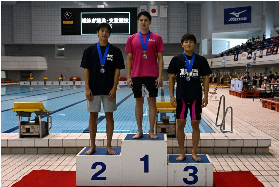
横泳ぎ競泳・男子